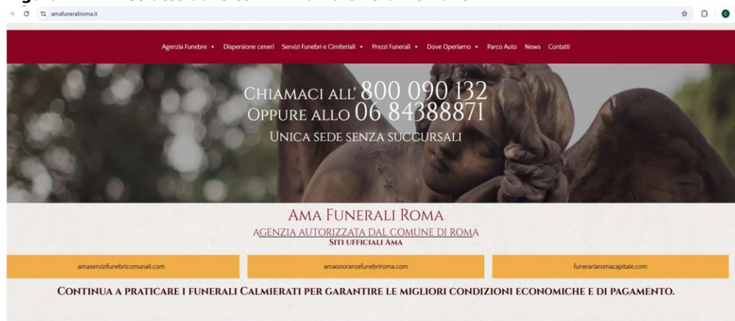
Figura n. 1 – Estratto dal sito www.amafuneraliroma.it

3. Su tali siti, infatti, il Professionista si accreditava, a partire almeno dal marzo 2025 1 , come "Agenzia ufficiale Comune di Roma", utilizzando diciture quali, ad esempio: "AMA FUNERALI ROMA- AGENZIA AUTORIZZATA DAL COMUNE DI ROMA- SITI UFFICIALI AMA" (v. figura n. 1); "A.M.A. SERVIZI FUNEBRI COMUNALI ROMA: SITO UFFICIALE Servizi Funebri Roma: Agenzia Autorizzata del Comune di Roma" (vd. figura n. 2); "FUNERARIA ROMA CAPITALE Agenzia Autorizzata dal Comune di Roma SITI UFFICIALI AMA" (vd. figura n. 3), nonché facendo ricorso sui propri siti al logo "SPQR" (vd. figura n. 4), lasciando così intendere di operare per conto o in convenzione con il Comune di Roma , anche in forza di un rapporto di fornitura tra la stessa FRC e l'Azienda Municipale Ambiente S.p.A., denominata anche AMA S.p.A. 2 .